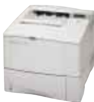
HP LaserJet 4100/N

Bewährte HP LaserJet Leistung für professionelle Anforderungen – Verschiedene Modelle in Verbindung mit ausgereiften Drucklösungen ermöglichen eine flexible Anpassung an die Bedürfnisse des Einsatzbereichs und bieten eine einfache Handhabung.