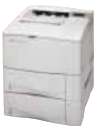
HP LaserJet 4100TN/DTN