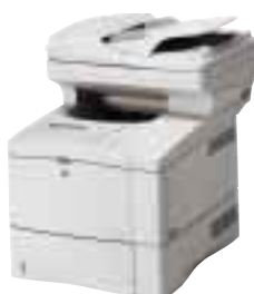
HP LaserJet 4100MFP

Der HP LaserJet 4100 ist ideal für professionelle Anwenderteams. Er bietet konstant hohe Leistung und ausgereifte Druckermanagement-Funktionen, ist E-Service-fähig und vorbildlich erweiterbar.