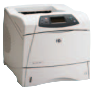
HP LaserJet 4200/N und HP LaserJet 4300/N

Mit ihrer hohen Druckleistung und Druckqualität übertrifft die HP LaserJet 4200/4300 Serie die Erwartungen der Anwender. Die intelligenten, vielseitigen und zuverlässigen Schwarzweißdrucker bieten eine Vielzahl bedienerfreundlicher Funktionen für den Einsatz in Arbeitsgruppen und die einfache Verwaltung der Drucker im Netzwerk.