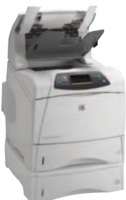
HP LaserJet 4200DTNSL und HP LaserJet 4300DTNSL

Die Drucker der HP LaserJet 4200 und HP LaserJet 4300 Serie bieten professionellen Anwendern sowie kleinen, mittleren und großen Unternehmen die zuverlässige Leistungsfähigkeit eines HP LaserJets, einmalige Vielseitigkeit und bedienerfreundliche Lösungen zur Bewältigung der hohen Druckvolumen in Arbeitsgruppen mit 5-15 Anwendern.