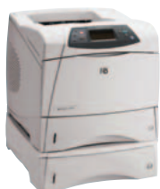
HP LaserJet 4200TN und HP LaserJet 4300TN