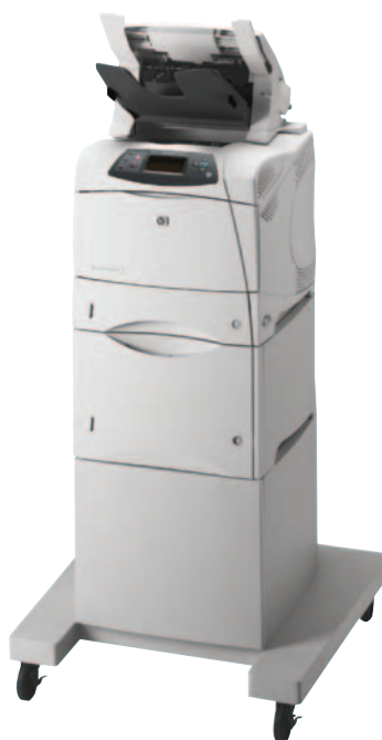
HP LaserJet 4200/4300 mit optionalem Zubehör