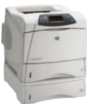
HP LaserJet 4200DTN und HP LaserJet 4300DTN